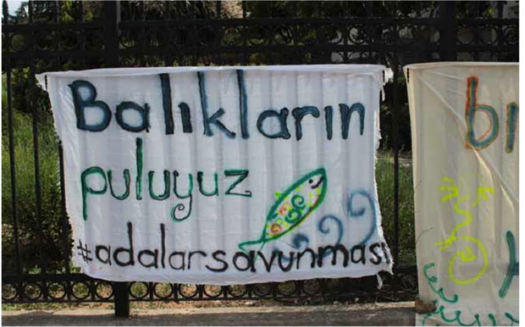
Mesa Holding Önü, Çengelköy, 29 Mayıs 2015