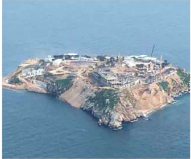
Yassıada, Nisan 2016

Hükümet ve Çevre ve Şehircilik Bakanlığı tarafından yapılan proje ve planlara karşı açılan davalar devam etmesine, inşaatın durdurulması yönünde bilirkişi raporları bulunmasına rağmen hız kesmeden devam eden bu büyük doğa ve kültür katliamı sonucunda Yassıada'da her gün yeni bir beton yığını yükseliyor. Yassıada'nın yüzeyindeki doğal hayat tümüyle yok edilirken, kıyılarındaki hassas ekosistem her dakika biraz daha tahrip ediliyor, adanın arkeolojik ve tarihi kayıtları büyük bir beton ve hafriyat yığını altında kayboluyor.